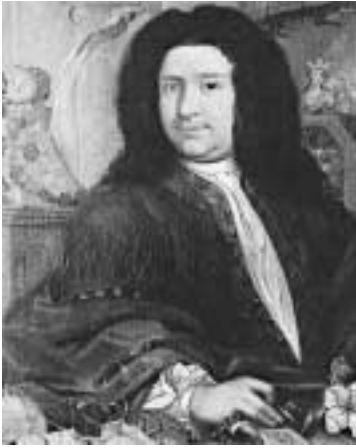
Fig. 2. Kilian Stobæus (1690-1742). Repro.

riska roman "Waldemar Seier", egde Brattingsborg sin tillvaro långt in i medeltiden. Den fromme erkebiskopen Anders Suneson, Waldemar Seiers trognaste vän, som angräpits av en förfärlig sjukdom, spetälska, hade nedlagt sitt embete och flyttat till Ifö, hvarst han i en enslig cell framlefde sina dagar under böner, botöfningar, läsning i bibeln och utarbetandet af en lagbok. Han fick underrättelse om, att krigsfolket på Brattingsborg röfvat till sig en mängd penningar, hvarmed de spelade och lefde vildt långt in på nätterna. Biskopen uttalade då en förbannelse öfver det förläddande myntet, och krigarne blefvo ej litet förvånade öfver, att följande morgon finna alla sina penningar i små runda stenflisor med ett hemskt grinande döds skull till prägel. v