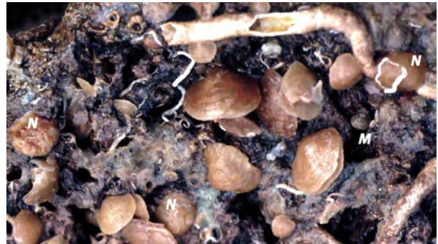
Figure 2 : Fond rocheux dans le Bathyal supérieur (255 m de profondeur) au large de l'île de Porquerolles (Provence, France) avec des Novocrania anomala (N), des Megathiris detruncata (M) et de nombreuses Megerlia truncata , dont certaines présentent la forme monstruosa avec déformation de la coquille en fonction du substrat. Ces espèces se trouvent aussi sur des branches du scléactiniaire Dendrophyllia cornigera (Pl. 1).

l'autre Sicile (...): en 1795, le Royaume des Deux-Siciles était formé par le Royaume de Naples et par la Sicile, la capitale étant Naples. Dans sa préface (Poli, 1795, vol. 1) indique que les récoltes venaient de la mer Adriatique, la mer de Sicile, la mer Tyrrhénienne. Giuseppe Saverio Poli (1746-1825) était un physicien, médecin et naturaliste italien. Il s'installe à Naples en 1790. Il fut le tuteur du prince-héritier François de Bourbon. Ses collections sont au Museo Zoologico, Centro Musei delle Scienze Naturali, Napoli.