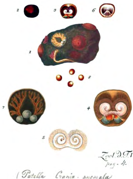
Figure 3 : Fac-similé des figures sur Patella - Crania anomala de la planche de Müller (1788), avec les légendes originales (en p. 4 comme indiqué sur la figure) ci-dessous.

Les deux espèces actuelles nommées Novocrania anomala et N. turbinata (Tableau 1) ont toujours fait débat quant à leur état comme espèces séparées ou comme synonymes. Donc, sans faire ici un historique exhaustif, quelques faits marquants méritent d'être relatés avant de conclure sur la place de chacune au sein du genre.