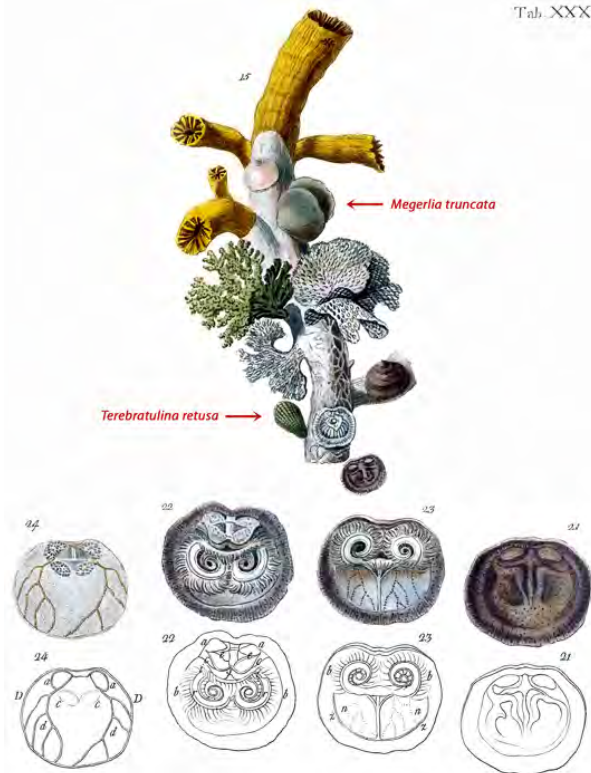
Figure 1 : Extrait en fac-similé des figures sur Anomia turbinata (Anomie Conique) de la Planche XXX de Poli (1795), avec les légendes originales :

Figure 1 : Extract in facsimile of the figures on Anomia turbinata (Conical Anomie) of the Plate XXX of Poli (1795), with the original captions: