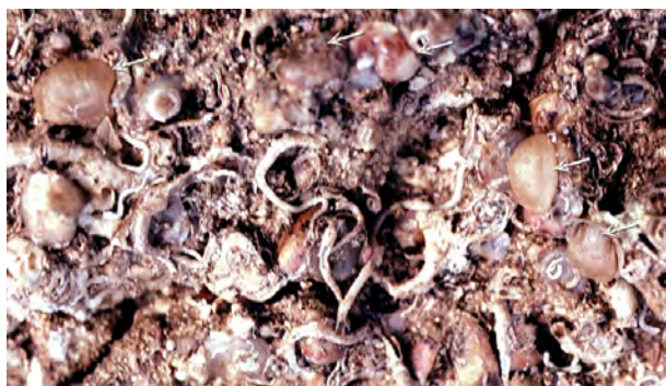
Figure 4 : Fond rocheux avec des Novocrania anomala (flèches) dans l'étage Bathyal supérieur près de Calvi (Corse) à 210 m de profondeur. On distingue aussi quelques anciennes valves ventrales.

Atlantique, ou une large répartition géographique extra-méditerranéenne (voir Emig & Geistdoerfer, 2004). Enfin, en profondeur, c'est sur la pente continentale méditerranéenne que Novocrania anomala montre les plus fortes densités (Fig. 4 ; Pl. 1).