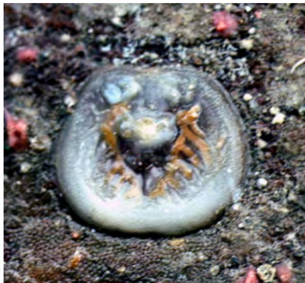
Figure 5 : Valve ventrale de Novocrania anomala sur un fond rocheux vers 120 m de profondeur au large d'Avilés (Golfe de Gascogne, Espagne : Campagne Fauna II, juin 1991, programme Fauna Ibérica, N/O García del Cid).

two forms here as separate species, this will need to be confirmed by molecular biology studies."