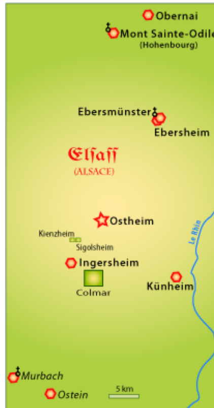
Fig. 2. - Localités (noms actuels) citées en Alsace. À comparer avec la Fig. 9 (carte politique de l'Empire des Francs entre le VI e et X e siècle).

Le texte (en latin – facsimilé : Fig. 3, 4) de cette donation a été publié par Schannat (1724) et Grandidier (1787). La transcription correcte du lieu est bien Osthaim ou Ostheim (Fig. 3-5) -et non Osthain, probablement une erreur de lecture- (Schannat, 1724, p. 38-39 ; Grandidier, 1787, p. 43-44 ; Stengel, 1956) (Fig. 3-4). On le retrouve sous Ostheim dans les années 800 (Schannat, 1724, p. 398, 404 et 420) (Fig. 5). Le texte précise in villa & in marca denominata Osthaim , ce qui signifie, à cette époque francique, qu'il s'agit d'une ferme, voire d'un ensemble de fermes avec leurs habitations rurales, ainsi que le territoire situé en bordure et voisinage (définition de marca selon le DMF, 2015). Il est intéressant de noter que le mot village vient du latin médiéval villagium , vers le XI e siècle, défini comme un groupe d'habitations rurales, qui est lui même dérivé de vil(l)e, signifiant ferme, du latin villa (= maison de campagne, ferme, métairie...). En Alsace, villa sera remplacé par Dorf (= village) du vieux haut-allemand ( Althochdeutsch ) qui apparaît vers cette époque ; à l'origine, Dorf ne distinguait pas entre une seule et plusieurs fermes.