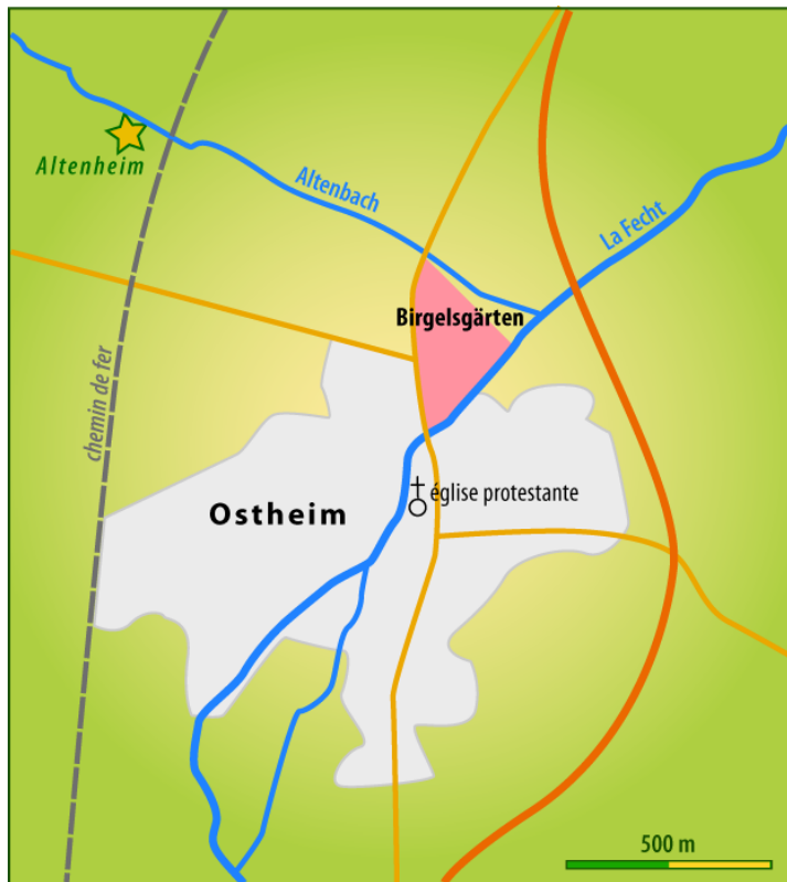
Fig. 1. - Localisation des fouilles (en rose) au Birgelsgärten 2 , lieu où se situait Osthaim ; le cadre de la figure correspond à une surface d'environ 400 ha. À noter que le hameau Altenheim, mentionné sur la carte Cassini, a aujourd'hui disparu.

(Oberhof) qui aurait été donné à l'abbaye d'Ebersmünster par Charlemagne.