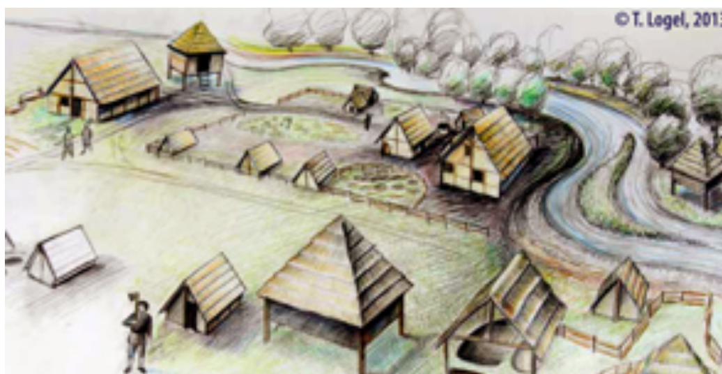
Fig. 11. - Croquis de restitution du site d'Ostheim d'après Logel (2013).

A partir de l'emplacement des diverses structures architecturales, représentées sur la Fig. 10, Logel (2013) a proposé une restitution du site d'Ostheim (Fig. 11). Ce lieu correspond au site Ostheim et marque ainsi l'emplacement primitif du village actuel d'Ostheim.