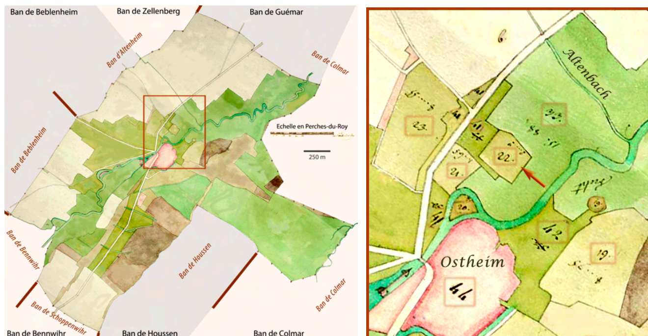
Figure a. - Chronologie Cadastre du ban communal d'Ostheim établi au XVIIIe siècle, avec les bans voisins et leurs limites (en brun) - et les bans (en rosé ou gris) des communes actuelles (noms en noire). Carte modifiée.