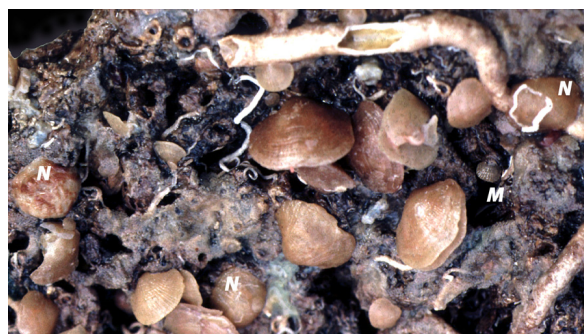
Figure 2 : Fond rocheux dans le Bathyal supérieur (255 m de profondeur) au large de l'Ile de Porquerolles (Provence, France) avec des Novocrania anomala (N), des Megathiris detruncata (M) et de nombreuses Megerlia truncata , dont certaines présentent la forme monstruosa avec déformation de la coquille en fonction du substrat. Ces espèces se trouvent aussi sur des branches du scléactiniaire Dendrophyllia cornigera (Pl. 1).

En l'absence d'une diagnose vraie (voir Commission Internationale de Nomenclature Zoologique, 1999, et Conclusion) permettant d'identifier Novocrania anomala et N. turbinata , l'usage du nom de l'une ou de l'autre a toujours été laissé à l'appréciation de l'auteur qui identifiait des cranes de Méditerranée. En fait, les auteurs méditerranéens souvent rapportaient leurs cranes à turbinata , car elle représentait une forme