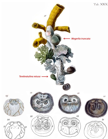
Figure 1 : Extrait en fac-similé des figures sur Anomia turbinata (Anomie Conique) de la Planche XXX de POLI (1795), avec les légendes originales.