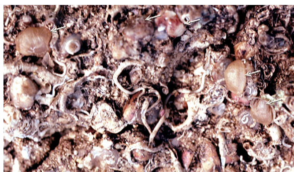
Figure 4 : Fond rocheux avec des Novocrania anomala (flèches) dans l'étage Bathyal supérieur près de Calvi (Corse) à 210 m de profondeur. On distingue aussi quelques anciennes valves ventrales.

Table 1 : Type locality and synonyms for both species Novocrania anomala and N. turbinata . Craniids species have often been described under the genus names Patella , Anomia or Orbicula . Later they were placed in the genus Crania RETZIUS, 1781 (see EMIG, 2009). Then, LEE & BRUNTON (1986) created the genus Neocrania for the living species, changed to Novocrania LEE & BRUNTON, 2001.